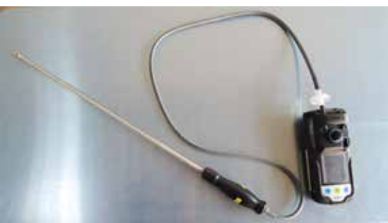
Mehrgasmessgerät mit Teleskop-Saugrohr

Die auf den Bildern gezeigten Messgeräte und Ausrüstung sind bei der FF St. Andrä-Wördern auf den Einsatzfahrzeugen aufgerüstet.